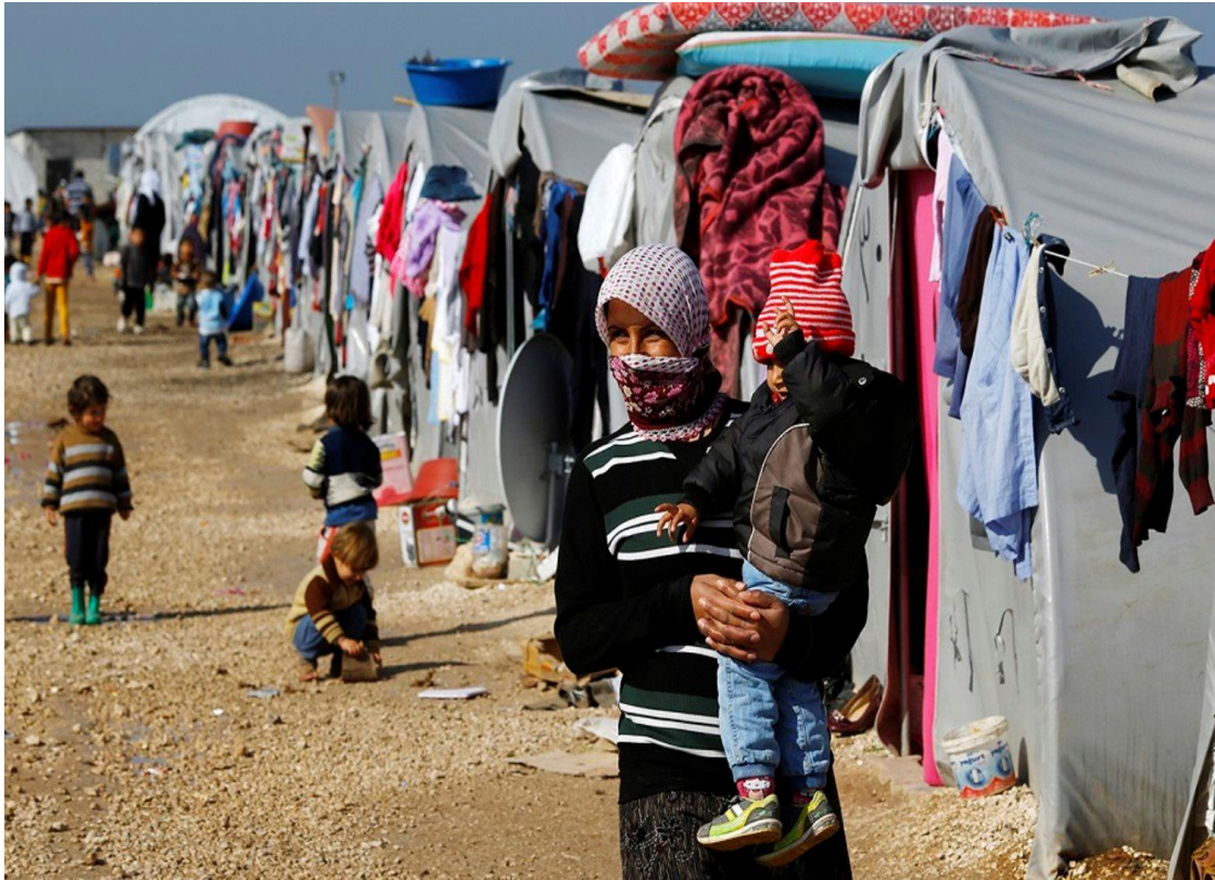
ژینکی خەنکی شاری عەفرین لە گەل کۆرپەکەى لە کەمبى پەنابەران لە شارۆچکەى سنوورى سوورچ لە پارێزگای شانلی ئۆرفا بە پێ دەرۆن.

لە دوای رووخانی دەولەتی عوسمانی و لە ئەنجامی دابەشبوونی کورد بە پێی پلانی سایکس-پیکۆ، یەکیک لە تەحەددیات و پەرسە گرینگەکانی ئەو وڵاتانە، پرسی کورد بووه و ئیستاش هەر ماوه. ناوچە کوردنشینەکانی ئەم سێ وڵاتە هەمیشە وەک بێزارکەرێک لە لایەن حکومەتی ناوەند و دەرەووه تەماشای کران و بوونیان لە ناوچە بەپیتەکانی دەولەمەند بە سامانی سڕوشتی، ئەم دۆخەى خراپترکردووه. ئەوێ روونە لە سەردەمی رووخانی ئیمپراتۆریەتی عوسمانییەو تا کۆتایی دەسەلاتی حزبی بەعس لە عێراق و شەری ناوخی سووریا، بەشێکی هاوبەشی هەموو کوردەکانی ئەو چوار وڵاتە، نەکوئیکردن لە مافەکانیانە لە فۆرمی سەرکوتکردن، خنکاندن، لەسێدارەدان، کوشتنی بەکۆمەل و جینۆساید لە لایەن حکومەتە ناوەندیەکانی عێراق، سووریا، ئێران و تورکیاوه.