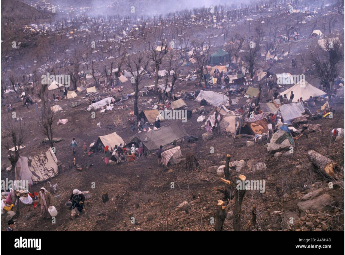
نێكەى يەك ملیۆن و نیو كورد پېش هېژى هېزە عېز اقبییهكان هەلاتن، بەلام توركيا سنوورەكانى داخست و سەدان هەزار كەس لە ۳۱ نازارى ۱۹۹۱ پەنايان بۆ شاخەكان برد.

لە ناوهراسى مانگى نازارى سائى ۱۹۹۱ خەئكى كوردستان پاپەرىن و رېژىمى بەعسىان لە ناوچەكە پامائى. دو ابەدوای ئەم پاپەرىنە، رېژىم بە نۆپەراسیۆنى سەربازى چروپ بەشېك لە خاكى كوردستانى كۆنترۆل كردهو، لە ئەنجامدا هەزاران كەس لە ترسى تۆلەسەندنەو دەسەلاتى بەعس، بەرەو ناوچە شاخاوییهكان و سنوورەكان كۆچیان كرد.