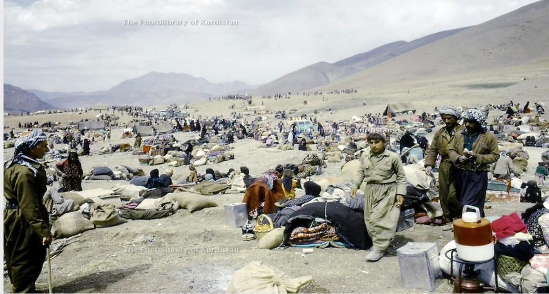
Irak 1974. Les réfugiés kurdes à la frontière iranienne. Iraq 1974. Kurdish refugees at the Iranian border

دوابة دواى كودە تاكەى «عەبدولكەرىم قاسم» لە ساى ۱۹۵۸، لە دەستوورى نوێى عێراقدا، مافى نەتەوھىيى كورد بە فەرمى ناسىترا و پارتى ديموكراتى كوردستان بوو بە پارتىكى فەرمى و بزوتنەوھەكە پىنگايەكى نوێى لە بەرخۆداندا گرتەبەر. دواى گەرانەوھى مەلا مستەفا بۇ عێراق مەملەتەكان لە ساى ۱۹۶۱ دەستیان پى كوردەوھە و نەم پىرۆسەيە بووھە ھۆى دەست پى كوردنەوھە شەپى كورد لە گەل پىژىيە بە عەس و دواجار لە ساى ۱۹۷۰ بە پىنگەوتنى ناشتى كۆتايى ھات كە ئۆتۆنۆمى بە كورد بەخشى. نەم پىنگەوتنە زمانى كوردى وەك زمانىكى فەرمى ناساند و بەشىك لە دەستوورى عێراقى بەم شىوھەيە ھەموار كوردەوھە: "گەلى عێراق لە دوو نەتەوھە پىك دىت، نەتەوھى عەرەب و نەتەوھى كورد". بەلام نەم پىنگەوتنە شكستى ھىنا و بووھە ھۆى ناكۆكى و شەپە لە ساى ۱۹۷۴. لە ئەنجامى ئەو شەپە و مەملەتەكانى لە كوردستانى عێراق روويان دا، ژمارەيەكى زۆر لە پەنابەران لە سنوورى رۆژناوا و باكوورى رۆژناواى ئىرانەوھە چوونە ناو رۆژھەلاتى كوردستان. ھەرھوھە دواى پىنگەوتنى ئىران و عێراق لە جەزائىر، شەپۆلىكى دىكەى گەورەي پەنابەران لە ماوھەيەكى كورتدا ھاتنە ناو كوردستانى ئىران (رۆژھەلاتى كوردستان). [۱۵]