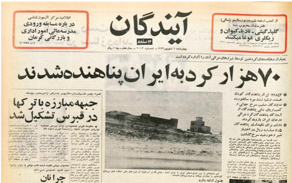
راپۆرتیکی رۆژنامه ی نایه نده سه باهه ت به ها تی په نا به را نی کورد له سائی ۱۹۷۴.

به لأم له سائی ۲۰۰۳ دا گۆرانکارییه کی تری چاره نووس سازیه قازانجی هیژه سیاسییه کانی ناوچه که رووی دا. له گه ل داگیرکردنی به غدا و پروخانندی سه دام، به کرده وه گه وره ترین دوژمنیان له ناو چوو و نه مجارهش ده رفه تیک بۆ به ده ستهینانی ئیمتیاژ له حکوومه ته تازه دامه زراوه که ره خسا. هه رته ی کوردستان نه که هه ره به پێ ده ستوو ره که حکوومه ته فیدرائی ناسیتر، به لکوو ۱۷% داها تی نیشتمانیی شی گرته ده ست. داها تی دارایی هه رته ته نها به و پاره یه سنوو ردا نه بوو که له لایه ن حکوومه تی ناوه ندی عیتر اقه وه ده درا. به هۆی هه بیوونی به ره ی عه لمانی زیاتر به به راورد له گه ل شیعه و سوننه کانی عیتر اق، کوردیش سوودی له یارمه تی دارایی و سه ربازی ئه مریکا وه رگرت. جگه له وه ش، به سه رکردایه تی مه سه ووود بارزانی، کورد ورده ورده مه یلی زیاتری بۆ هه لسوکه وتی سه ره به خۆ له به غدا هه بوو، په یوه ندییه کانیان له گه ل لایه نه بیانییه کان، به تایبه تی تورکیا. به بن مؤله تی حکوومه تی ناوه ند فراوانتر کرد، ته نانه ت نه وتیشیان به تورکیا ده فروشت به بن هه ماهه نگی له گه ل سه ره کوه زیرانی عیتر اق [هه مان].