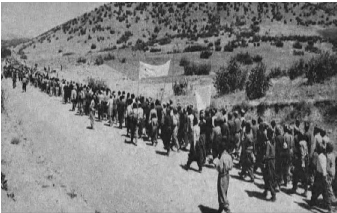
کۆچی ناره زایه تی به زۆره ملی مه ربوان بۆ گوندی کان میران له 31 گه لاوێتا تا 14 ئابی 1998.

نانارامیه کان له شاره کان به پده وام بوون تا له 19 ئابی 1979 [1358]. به هۆی فهتوای روهوئلا خومه یی سه باره ت به جیهاد دژبه کوردستان، دۆخه که گۆرا بۆ شه ر، کوردستان گه مارۆدرا و ژمارهیهک هیژی پێشمه رگه و سوپای پاسداران له شار و گوندهکانی کوردستان له مملانییدا کوژران. له و کاته دا کاک فوناد که وهک به رپرسی حزبی کۆمه له له بانه کاری ده کرد، له گه ل سه رکردهکانی دیکه ی کۆمه له، له گه ل جه لال تاله بانی (سه رۆکی یه کیتی نیشتمانی کوردستانی عێراق)، عه بدولپه حمان قاسملوو و شیخ عێزه دین حوسینی، چوو ه ناو گه فوگۆبه که وه و به و ناراسته یه ده ستی به چالاکیه کان کرد. به لام له پنگای گه رانه وه ی له بانه وه بۆ مه ربوان، له مانگی ئابی سا ئی 1979 [1358]. له نزیک گوندی به سته م، له گه ل نوێنه ری پێکخراوی چریکی فه دایی گه لی ئێران، له لایه ن کۆماری ئیسلامیه وه کوژرا. [13]