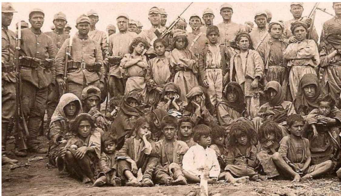
سەربازانی تورکیا لە کاتی جینۆسایدی دیرسیم و راگواستنیان بۆ ناوچەکانی تر (١٩٣٨) لە گەڵ مندالانی کۆچبەری کورد وێنە دەگرن.

لەو ماوەیەدا گەلی کورد لە سەرزەوی باوباپیرانی خۆی دەرکرا و ناچار بوو گوند و شارەکانی خۆی بەجێ بهێڵێت. ھێزەکانی تورکیا لە جەنگی جیھانی یە کە مەدا ئەم بەرنامە یەیان جێبەجێ کرد، ھەرچەندە ھیچ سەرچاوە و نامارێکی ورد و متمانە پێکراو لە بەردەستدا نییە، لەو ماوەیەدا نزیکە ٧٠٠ ھەزار کوردی کرمانج و زازا ناچار بوون روو لە ناوچەکانی دیکە ی تورکیا و ھەندیک ولایت لە و انەش رووسیا و یۆنان، بکەن. [٨][٩].